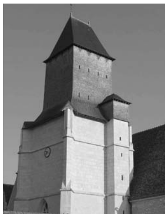
Clocher de l'église d'Avézé

★ Visites libres Samedi et dimanche 14h/19h ★ Exposition de photographies et de documents d'archives réalisée par l'association du patrimoine de Cormes ★ Animation musicale harpe et flûte Dimanche 15h30/17h (à l'église)