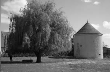
Pigeonnier, manoir de Bois-Doublet, St-Célerin