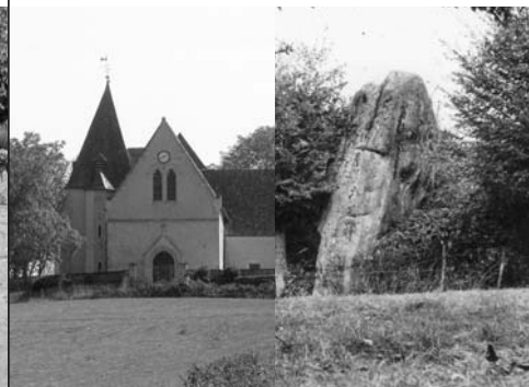
Menhir de Courtevais, Nogent le Bernard