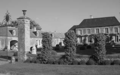
Manoir de Nuyet, Savigné- l'Évêque