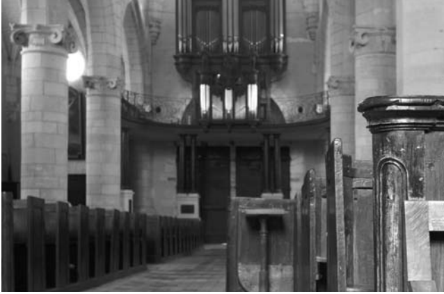
Eglise de Saint-Calais