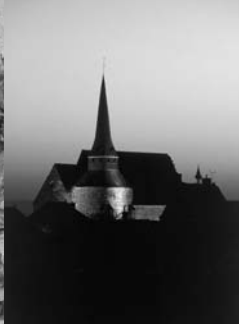
Eglise de Melleray