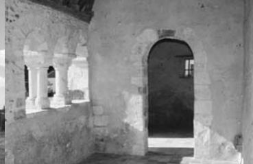
Porche de l'église de St-Aubin-des-Coudrais