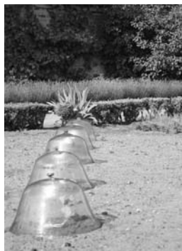
Jardin potager de Bonnétable