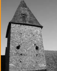
Église de Prévelles