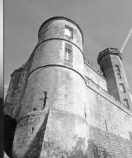
Château de Montmirail