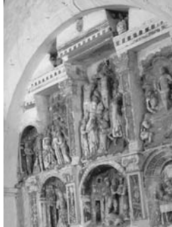
Retable du XVI e s., église de St-Jean-des-Echelles