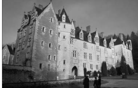
Château de Courtanvaux