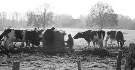
Paysage à Courcival