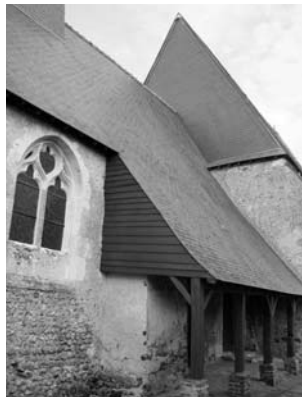
Ballet de l'église de Sainte-Cérotte

★ Visites libres Samedi et dimanche 8h30/18h