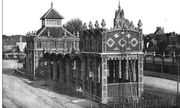
Ancienne gare de tramway, la Ferté-Bernard