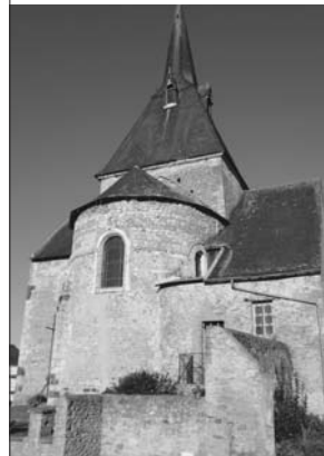
Chevet de l'église de Lombron

★ Visites libres Samedi et dimanche 9h/19h