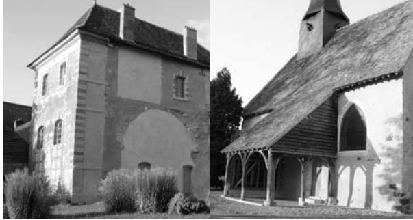
Prieuré Notre-Dame de Tuffé