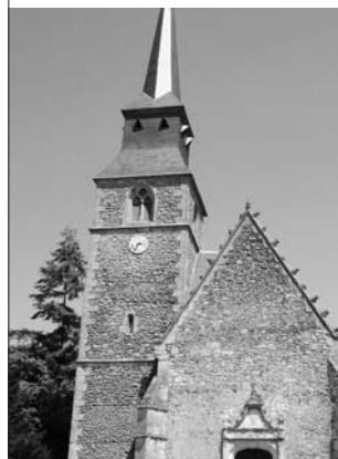
Eglise de Saint-Ulphace

★ Projection du film “Le bouc émissaire” de Robert Hamer (1959) tourné en partie à Semur-en-Vallon et La Ferté-Bernard Dimanche 17h30