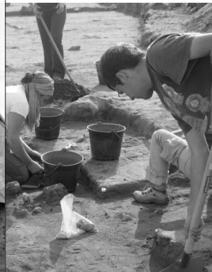
Site archéologique de la Motte, Gréez-sur-Roc

★ Visites libres et guidées Samedi et dimanche 14h/18h