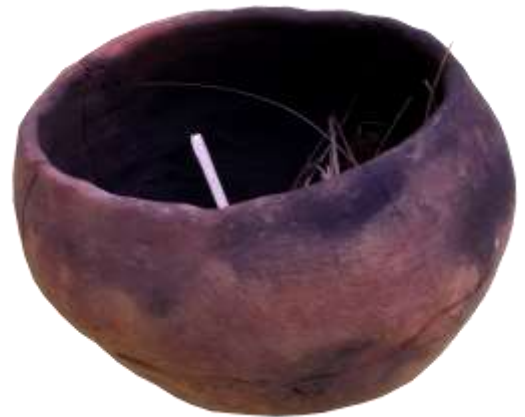
Reconstitution d'un pot néolithique Espace Jean Jousse