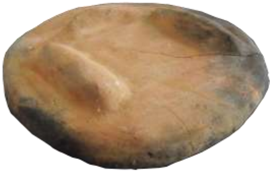
Reconstitution du "plat à pain" néolithique Espace Jean Jousse