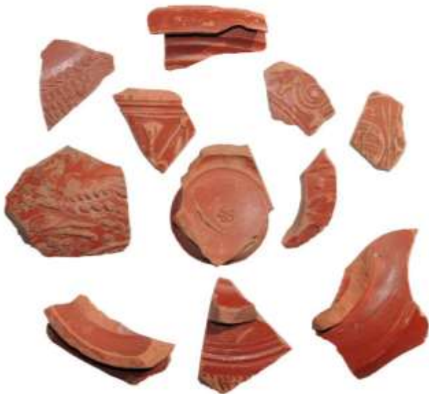
Céramique sigillée (origine Lezoux et La Graufesenque) antiquité gallo-romaine II e - III e siècle, Cormes (72) Prospection Société Pays Fertois