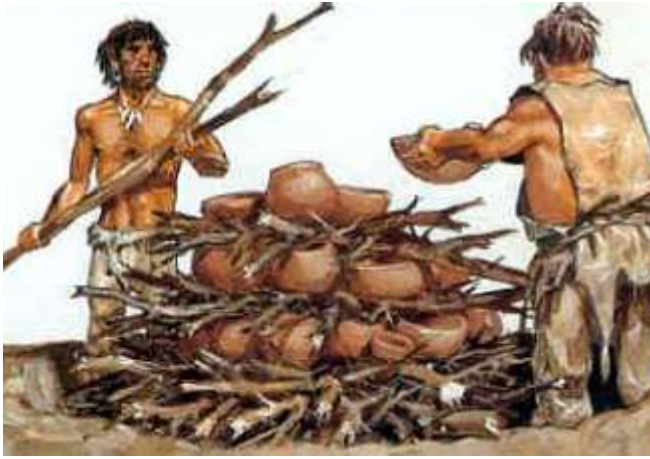
Four extérieur en meule